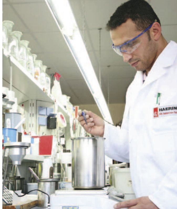
Unlängst erfolgte die Erweiterung der Forschungs- und Entwicklungsabteilung.

Zielgruppen des seit 1886 bestehenden Unternehmens sind neben dem Handwerk und dem Baustoffhandel auch Industriekunden, Maschinenbauer oder Kunststoffteilehersteller – um nur einige zu nennen.