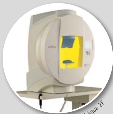
HAERATEX Aqua 2K