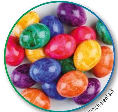
HAERALACK Aqua Eierschalenlack