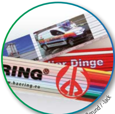
HAERING ® Durchstoßgrund / -lack