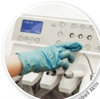
HAERING ® Antimikrobiell Aktiv