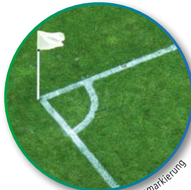
HAERING ® Rasenmarkierung